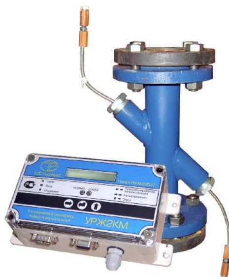
Рисунок 1 - Общий вид расходомера жидкости ультразвукового двухканального УРЖ2КМ

Общий вид расходомера жидкости ультразвукового двухканального УРЖ2КМ приведен на рисунке 1.