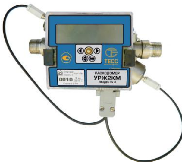
Рисунок 1 - Общий вид расходомера УРЖ2КМ Модель 3 (DN 20)